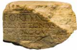
Zandsteen met Romeinse inscriptie gevonden op Thermerterrein (Thermenmuseum Heerlen)