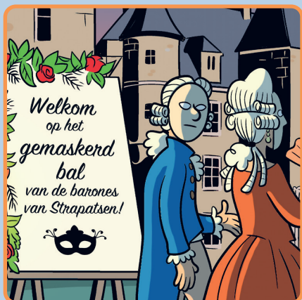
Het gemaskerd bal p. 16