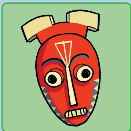
Het gestolen masker p. 28