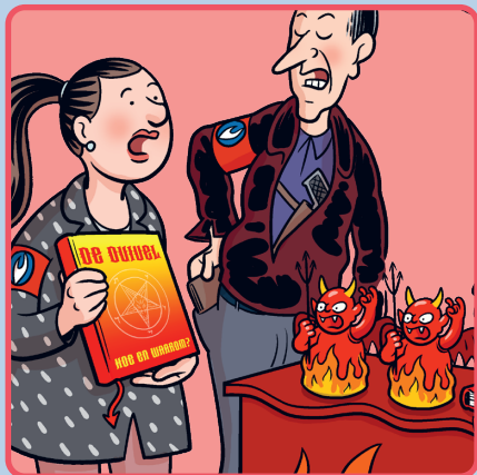
De ninja en de duivel p. 4