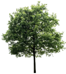
DE NATUUR IN