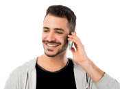
MET IEMAND PRATEN