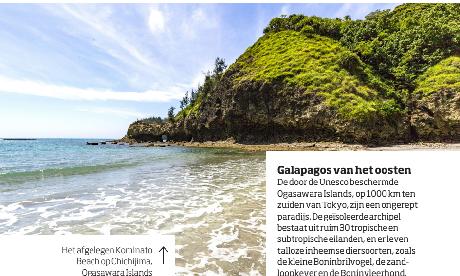
Het afgelegen Kominato Beach op Chichijima, Ogasawara Islands ↑

Japan is eindeloos fascinerend en een reis door het land voelt als één lange trip door een onbedorven landschap, ook al bent u omgeven door een mensenmassa. Buiten de toeristische route tussen Kyoto en de hoofdstad liggen bijna 7000 eilanden en tal van andere plekken op u te wachten.