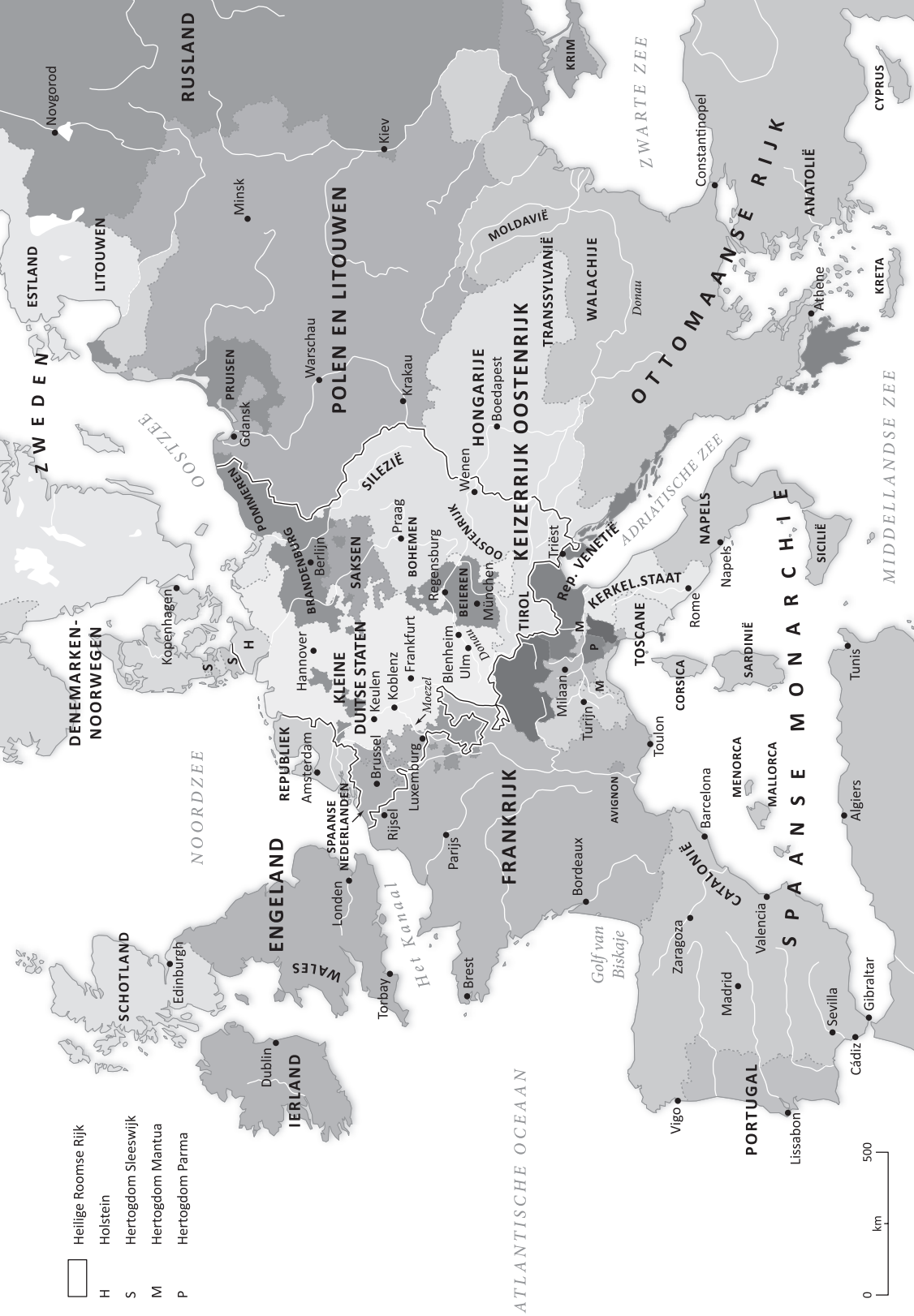
Europa omstreeks 1700