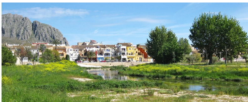
De rivier Girona bij Beniarbeig