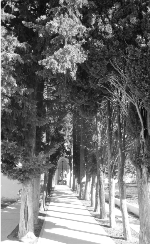
De toegang tot het kerkhof van Orba

We beginnen de route op de Plaza de España, bij de kerktoren. Vanaf hier dalen we af langs de calle del Pintor Ruano tot in de calle Carrer Baix, die we naar rechts volgen tot bij de rijweg CV-715 tussen Orba en Tormos (1). We steken de rijweg over en volgen een asfaltweg tussen boomgaarden met hoofdzakelijk sinaas-appels maar ook enkele olijfboomgaarden