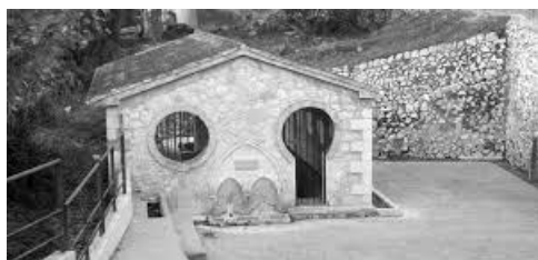
De Font de Baix is een van de vele bronnen in Orba, tegelijk een wasplaats, die werd gebouwd in 1904.

Hier draaien we naar links en nu moeten we deze weg helemaal verder lopen, ongeveer 1 kilometer lang, alle zijwegen negerend. Eerst lopen we nog een klein stuk door de straat van een urbanisatie, de Carrer Passera (8), daarna passeren we het sportcomplex (9) en dan komen we bij de rijweg CV-715 (10), die we oversteken om weer bij ons vertrekpunt te komen. We passeren de oude wasplaats bij de Font de Baix en begeven ons dan omhoog naar de kerk, waar we de tocht begonnen zijn.