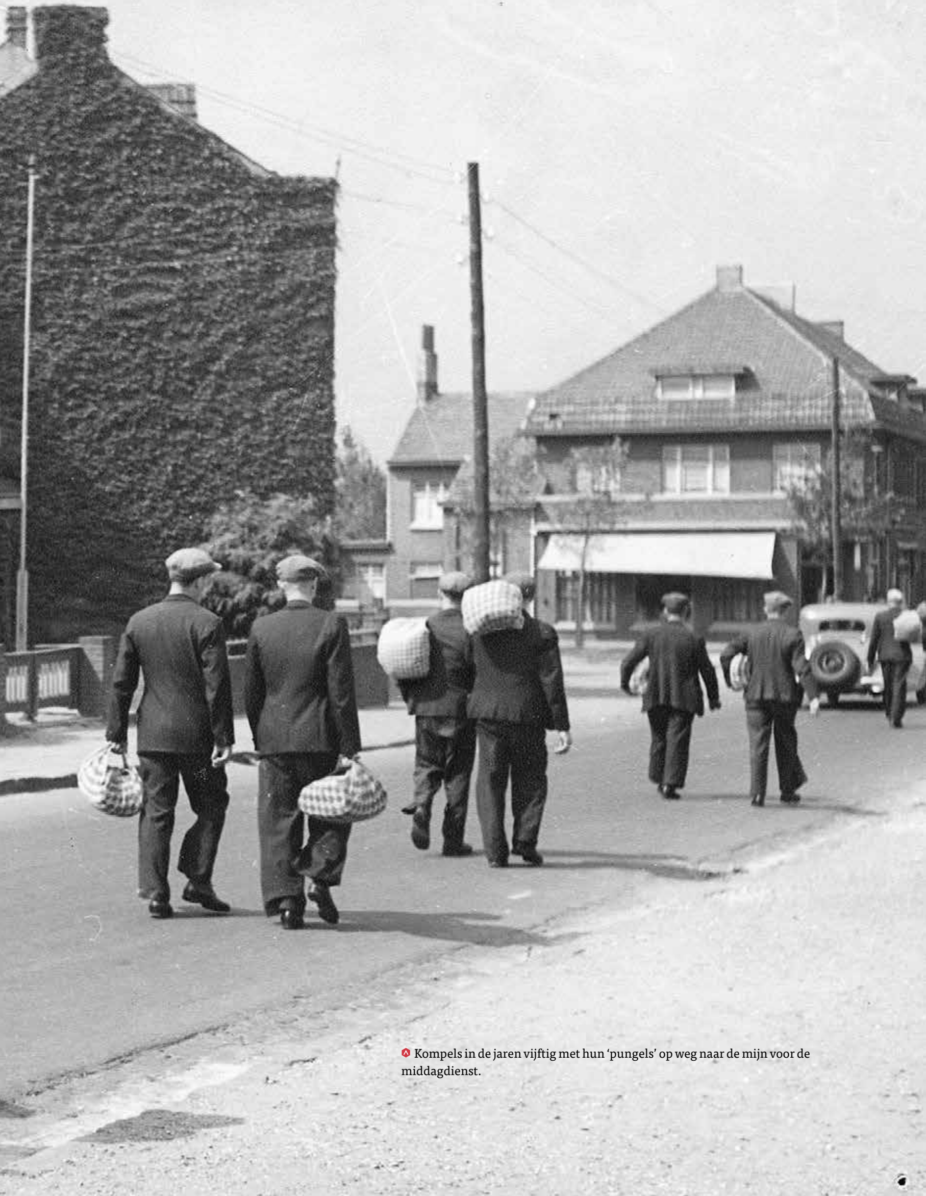
⬢ Kompels in de jaren vijftig met hun 'pungels' op weg naar de mijn voor de middagdienst.