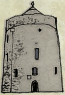
THE VIKING TRIANGLE