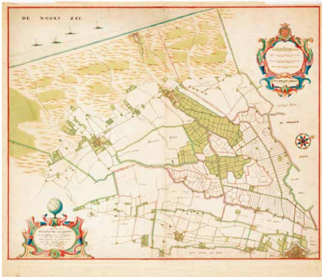
J.D. Zoutman , Kaart van het Graafschap Egmont, 1665, Kaarte van het Graafschap Egmont de heerlijkheit van Wimmenum alsmede van Heylo , Regionaal archief Alkmaar