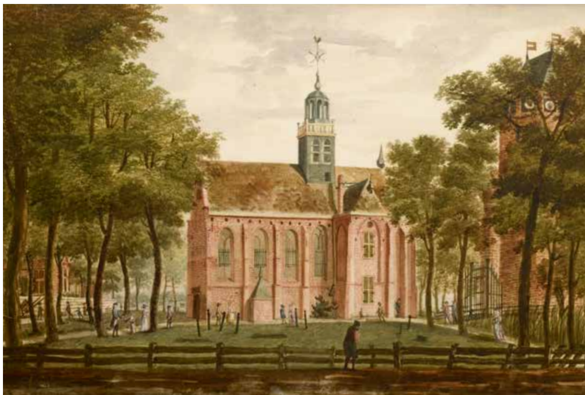
Anoniem , Kerk te Egmond aan de Hoef , rond 1800, 39,3 x 60,8 cm, aquarel op papier, Stedelijk Museum Alkmaar

Deze aquarel van de Slotkapel kan op basis van historische gegevens gesitueerd worden rond 1800, en mogelijk toegeschreven aan