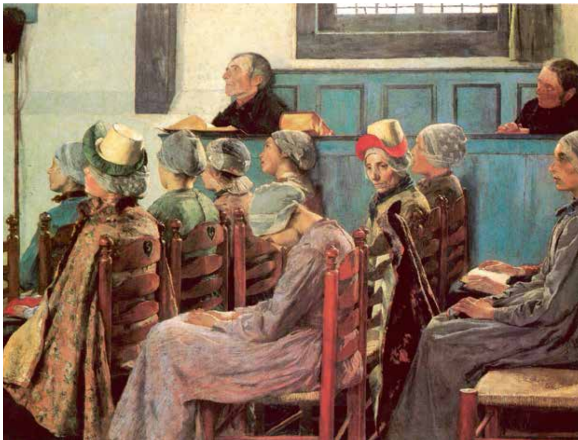
Gari Melchers , The Sermon ( De preek ), 1885, olieverf op doek, 159 x 220 cm, Smithsonian American Art Museum, Washington (DC)

Ook in het protestantse kerkje van Egmond-Binnen schilderde Melchers. Op het schilderij wist Melchers niet alleen de sfeer van devote kerk-gangers tijdens de dienst te treffen, maar ook de vermanende blik van een moeder. Tot haar ongenoegen is de dochter tijdens de preek in slaap gevallen.