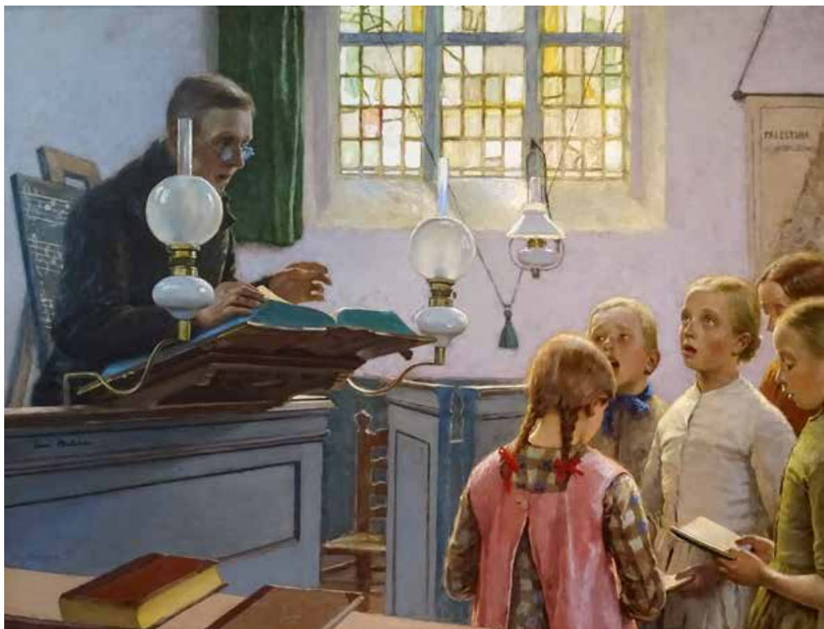
Gari Melchers , The Choirmaster , 1888, olieverf op doek, 124,5 x 172,7 cm, Gari Melchers Home & Studio, Fredericksburg, Virginia

Aan het einde van de Schoolstraat lag de Slotkapel aan de Slotweg. Behalve de bezoekers van de diensten, schilderde Melchers ook de kinderen die er kwamen zingen. Melchers doneerde een bijdrage aan het nieuw aangeschafte orgel dat in de Slotkapel werd geplaatst.