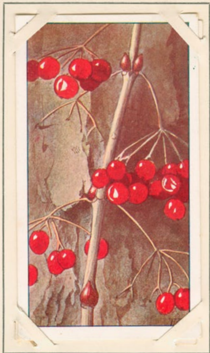
56. GELDERSCHE ROOS.