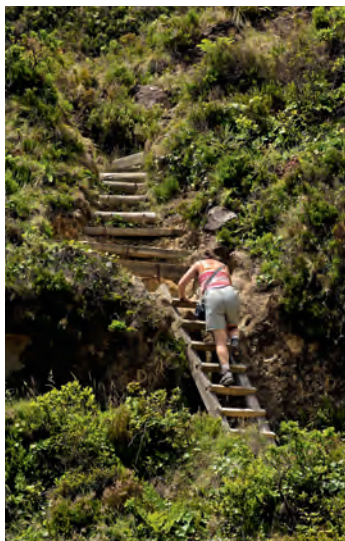
Het laatste stukje afdaling naar het meer.

Ver van de beschaving en schilderachtig ingebed in een ongerept landschap ligt het 'Vuurmeer' Lagoa do Fogo. Van een geliefd uitzichtpunt aan de noordkant dalen we, op een heldere dag zonder mist, af over een voetpad naar het op twee na grootste kratermeer van het eiland São Miguel en genieten van de natuurlijke stilte tijdens onze wandeling langs de oever.