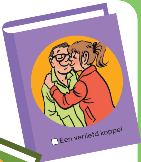
Een verliefd koppel