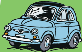
Een blauwe auto