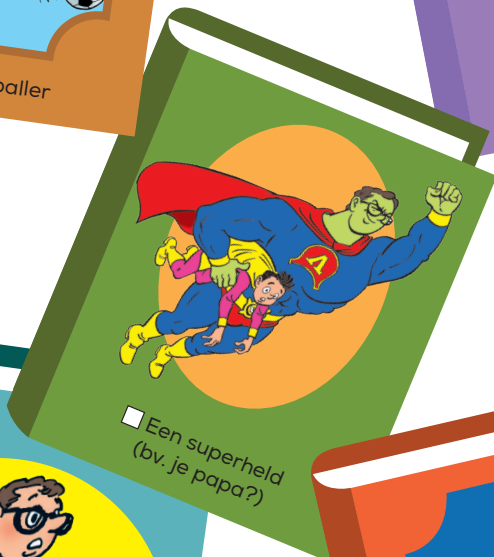
Een superheld (bv. je papa?)