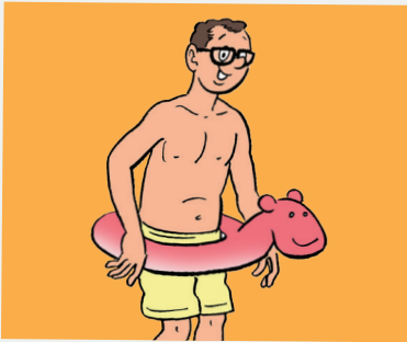
Een volwassen man met een zwemband