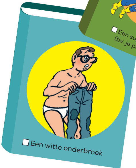
Een witte onderbroek