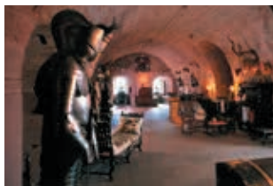
Interieur van Glamis Castle

Dit magische kasteel (blz. 40) is sinds 1372 een koninklijke residentie. Met torentjes, schatten en een link met Shakespeare's Macbeth .