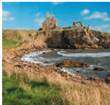
Newark Castle, Fife Coastal Path

Deze mooie wandeling verbindt de Forthbrug en Taybrug met elkaar. De route loopt van North Queensferry, bij Deep Sea World, naar de vissersdorpjes van de East Neuk, zoals Elie en Anstruther, die aan de voet van ruige kliffen liggen. De route gaat dan noordwaarts door de historische plaats en golfhoofdstad St. Andrews.