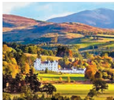
Blair Castle in Perthshire

Dit schitterende kasteel is de voorouderlijke zetel van de hertog van