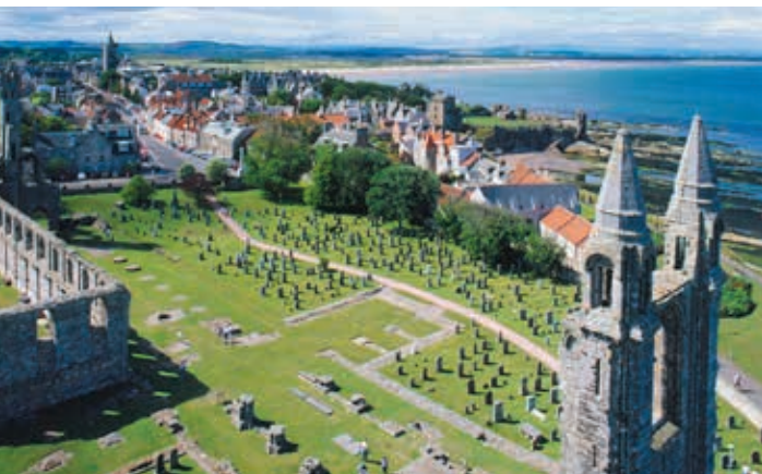
De ruïne van St. Andrews Cathedral

5 St. Andrews Kaart F5 ■ Kathedraal en kasteel: open april–sept. dag. 9.30–17.30 uur; okt.–maart dag. 10.00–16.00 uur; niet gratis ■ Golfbanen: 01334-466 666; www.standrews.com