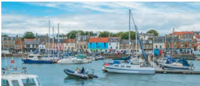
Jachten in de drukke haven van Anstruther

Neuk is een Schots woord voor 'hoek', en East Neuk verwijst naar een kleine bocht in de kustlijn waarlangs een opmerkelijke reeks pittoreske vissersdorpen ligt. Zij lopen van Earlsferry naar Crail, en elk is een juweeltje. Elie en Crail zijn de schilderachtigste en favoriete trefpunten van kunstenaars. Pittenweems mooie haven is nog steeds actief, en Anstruther, een haven voor jachten, heeft een drukke strandboulevard. Daar staat ook het boeiende Scottish Fisheries Museum (blz. 94).