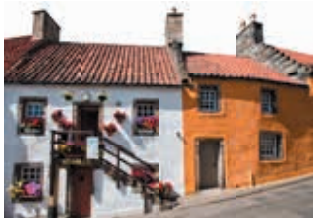
Leuke cottages in Culross

Twee uur rijden vanaf het centrum van Edinburgh en u bent ofwel in het majestueuze berglandschap van Perthshire of in het rijke boerenland van Fife, met langs de kust leuke dorpjes. Dit deel van Schotland is overduidelijk het diversst, met beroemde kastelen, abdijen, schepen, bruggen, wildreservaten en golfbanen, allemaal gemakkelijk bereikbaar met de auto. Golf is Schotlands grootste sporttraditie en is hier zeer aanwezig – met name in St. Andrews, de bakermat van de sport. De vele kastelen en paleizen getuigen van de voortdurende aantrekkingskracht van deze charmante en fotogenieke regio.