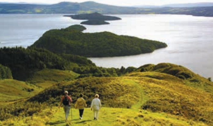
Schitterend uitzicht vanaf Conic Hill, West Highland Way