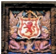
Wapen van Falkland Palace

Deze woning van Mary, Queen of Scots, en de Stuartkoningen vanaf 1541 ademt geschiedenis. U ziet er gerestaureerde slaapkamers en fraaie 17de-eeuwse tapijserieën. Intrigerend is de oudste