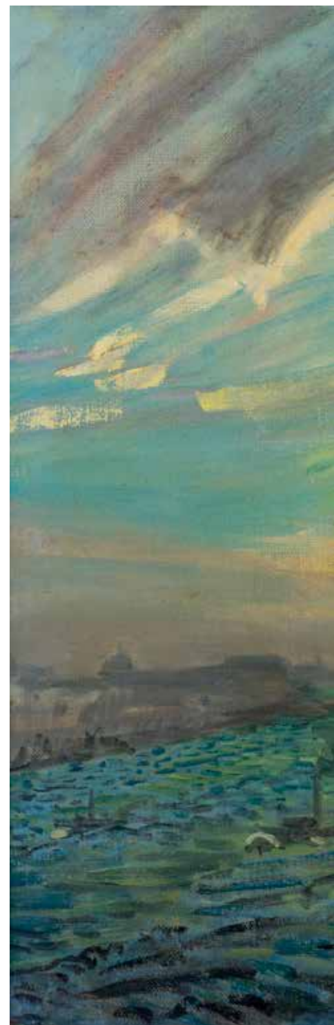
52.* Marius Richters Panorama van Rotterdam , 1953 Olieverf op doek, 368 x ca. 620 cm (3 delen van 368 x ca. 207 cm) Museum Rotterdam