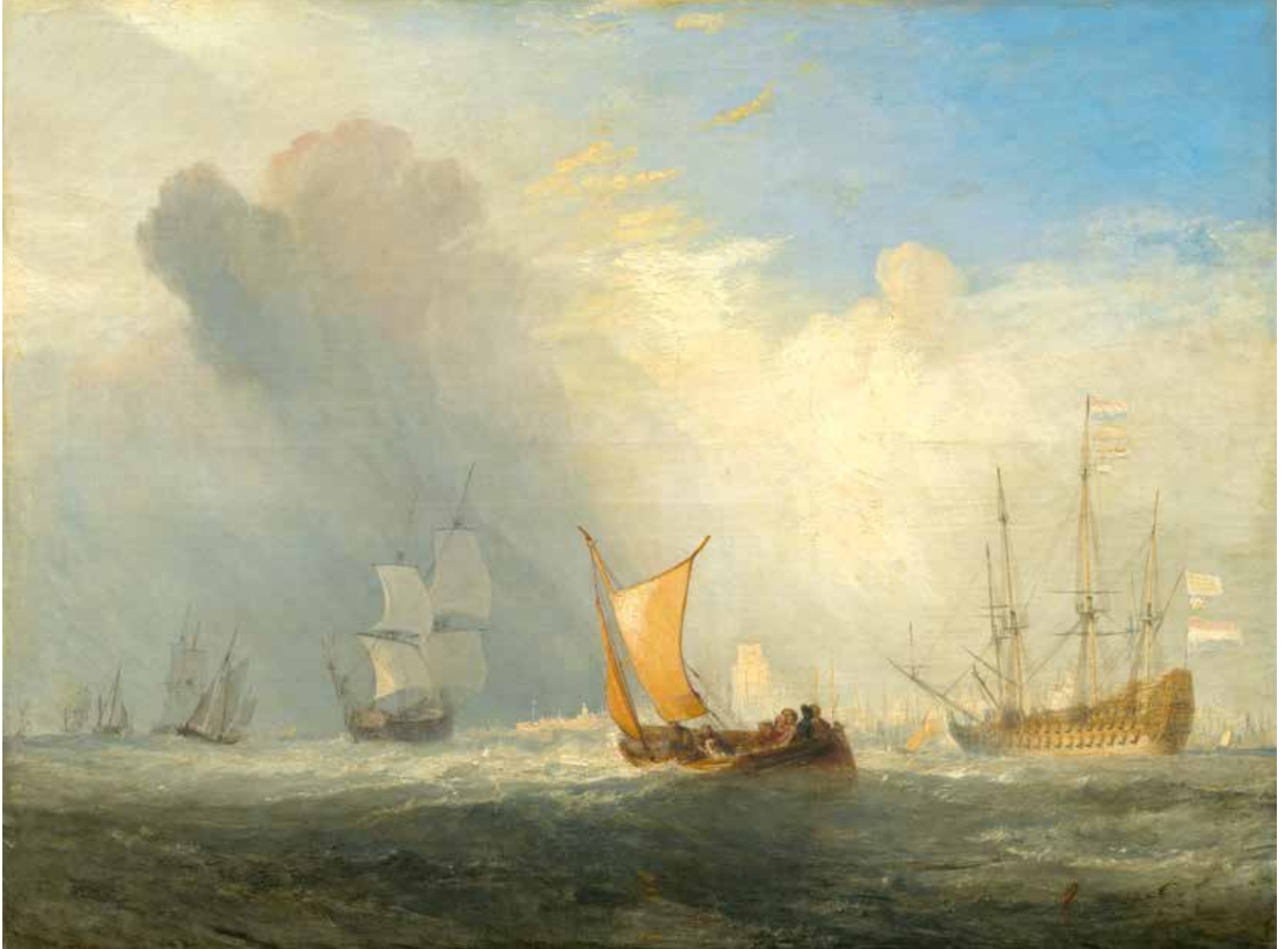
12. Joseph Mallord William Turner (1775-1851), De veerboot bij Rotterdam , 1833 Olieverf op doek, 92,3 x 122,5 cm Washington, National Gallery of Art, Ailsa Mellon Bruce Collection