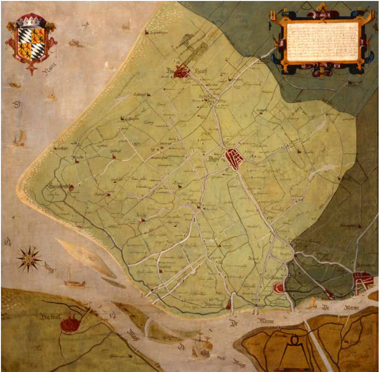
33. Matthijs Jansz. de Been van Wena (?-1620), Overzichtskaart van het Hoogheemraadschap van Delfland, 1606 Olieverf op doek, 120 x 123 cm Delft, Collectie Hoogheemraadschap van Delfland