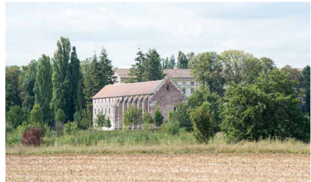
PAG. 16-17: DE OMMUURDE WIJNGAARD VAN CLOS VOUGEOT

Door de snelle verspreiding van het christendom werden vanaf de 10de eeuw overal in Europa abdijen gesticht. In 910 werd de benedictijnerabdij van Cluny gesticht, die op haar hoogtepunt in de 12de eeuw meer dan 1400 kloosters onder zich had, met