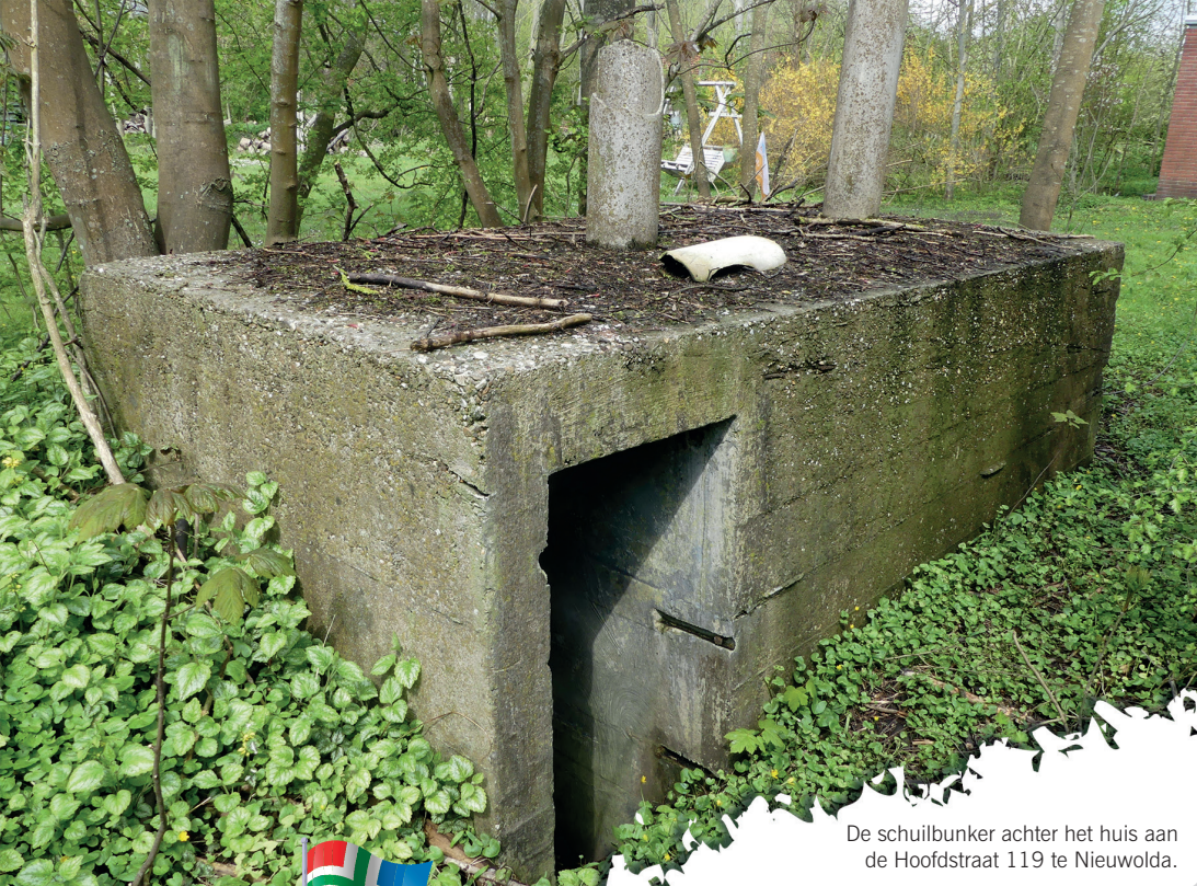
De schuilbunker achter het huis aan de Hoofdstraat 119 te Nieuwolda.