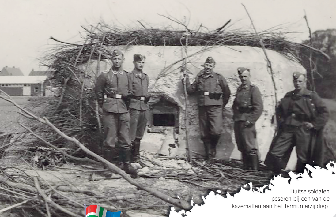
Duitse soldaten poseren bij een van de kazematten aan het Termunterzijldiep.