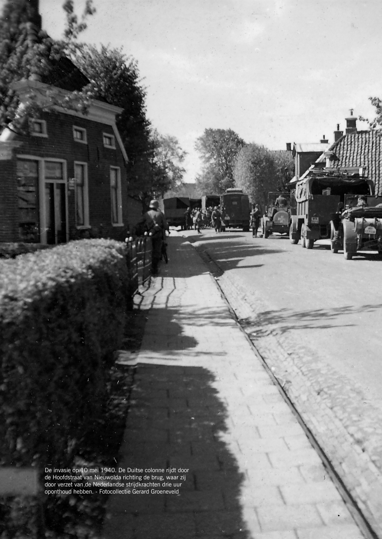
De invasie op 10 mei 1940. De Duitse colonne rijdt door de Hoofdstraat van Nieuwolda richting de brug, waar zij door verzet van de Nederlandse strijdkrachten drie uur oponthoud hebben.