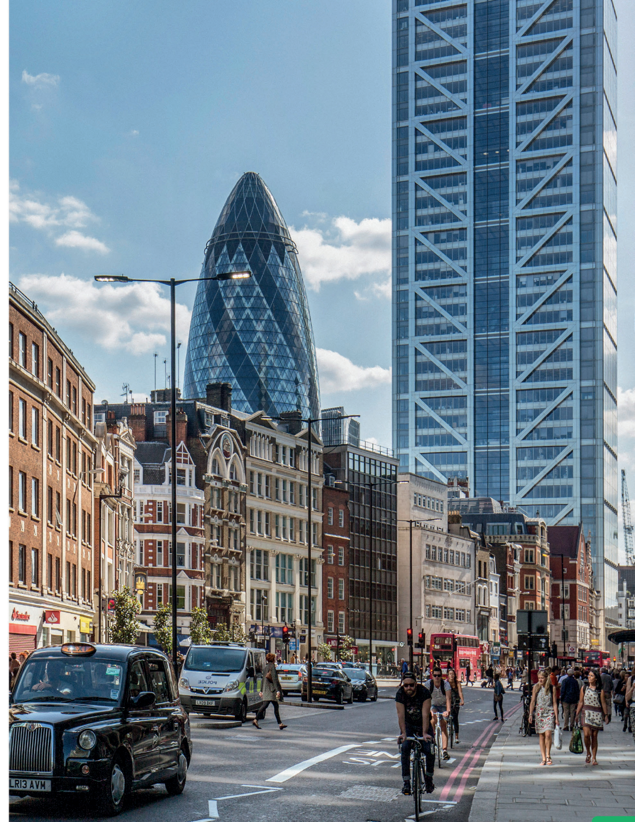
In Londen, de hoofdstad van het Verenigd Koninkrijk, staan moderne en oude gebouwen vlak bij elkaar. Er wonen negen miljoen mensen in deze Europese stad.

Er zijn natuurlijk grote verschillen tussen de landen in dit werelddeel, maar Europeanen hebben ook veel overeenkomsten. Zo is in de meeste landen voetbal de populairste sport en het christendom de belangrijkste godsdienst. Ook wonen er al heel lang mensen in Europa en vind je overal oude steden en bouwwerken van vroeger, zoals kastelen en stadsmuren. Europa is rijk en modern, met torenhoge wolkenkrabbers, elektrische voertuigen en grote windparken op zee. En dankzij de duizenden zendmasten die er staan, heb je bijna overal bereik met je smartphone.