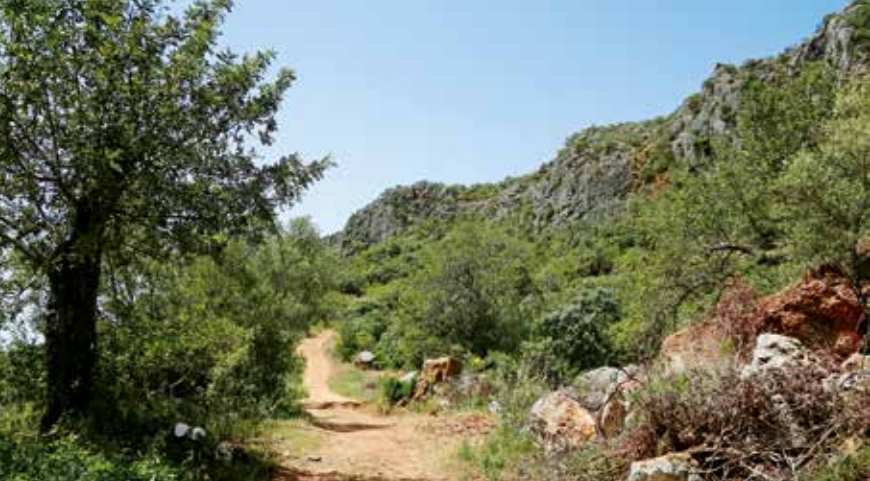
Langs de karstkliffen van de Rocha da Pena.

wandelroute en volgt u die naar links. U loopt plaatselijk steil naar beneden. Zodra de eerste huizen in zicht komen, gaat de onverharde weg over in een verhard pad. Links van de weg passeert u een waterbekken en zet u de wandeling voort over de geel/rood gemarkeerde weg naar het pittoreske centrum van het dorp Penina (5) . De gevels van de huizen zijn allemaal witgekalkt en slechts een enkele keer treft u blauw omrande ramen en deuren aan. Bij het verlaten van het dorp buigt de weg schuin links af en gaat over in een onverharde weg die op zijn beurt weer overgaat in een smal pad langs een muur. Al gauw bereikt u een breder grindpad dat u rechtdoor volgt. Links van u kunt u nog een keer genieten van het prachtige uitzicht over het massief. Het laatste deel van deze wandeling voert over een brede weg met lichte beklimmingen en afdalingen naar het dorp Rocha da Pena , waar u bij de dorpsfontein (1) de wandeling afsluit.