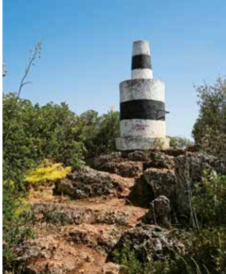
Op de top van de Talefe.

Deze rondwandeling begint bij de dorpsfontein (1) in Rocha da Pena . De Fonte dos Amados is een mooie fontein die om een johannesbroodboom heen is gebouwd. Tegenover de fontein loopt de route over een verharde weg omhoog in de richting van het uitzichtpunt op de berg. De weg gaat al gauw over in een onverharde weg en wordt geflankeerd door olijf-, vijgen- en aardbeibomen. Bij een bord dat informatie verschaft over de geologie van de omgeving, maakt de weg een grote bocht naar rechts en blijft gestaag klimmen naar de indrukwekkende hoogvlakte. Na ongeveer 700 meter bereikt u een duidelijk gemarkeerde kruising. Vanaf hier gaat u