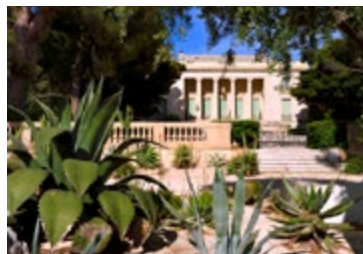
Villa Eilen Roctuinen

Deze geometrische tuin is een juweel van een Zentuin en contrasteert in grote mate met de vooral klassiek Franse tuinen aan de Riviera.