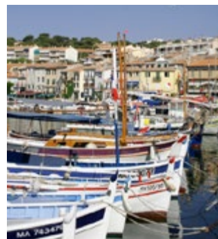
Het vissersdorp Cassis

9 Cassis Achter Cassis rijzen de hoogste kustkliffen van Frankrijk op, waardoor de haven en het oude centrum een knusse en intieme sfeer krijgen. De stranden trekken veel toeristen – de inhammen aan de westzijde zijn het leukst –, maar Cassis is en blijft een authentieke vissersplaats ( blz. 82 ).