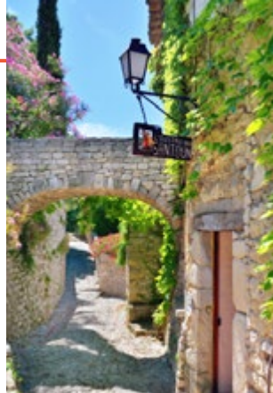
Keistenen straat in Séguret

4 Séguret Séguret ziet vanaf de uitlopers van de Dentelles de Montmirail uit over het weidse landschap. Het is een prachtig plaatsje, met autovrije straten, middeleeuwse gebouwen, hedendaagse kunstenaars en handwerkslieden ( blz. 129 ).