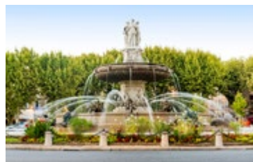
Fontein in Aix-en-Provence