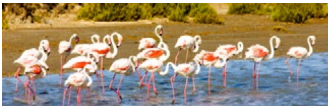
Flamingo's in de Camargue

De naam voor deze streek is treffend ( bouches betekent mondingen), want hier splitst de rivier zich in verscheidene riviertjes, die via de lagunes en grazige vlakten de Middellandse Zee in stromen. De Rhône begrenst de Provence in het westen en eeuwenlang is de rivier de hoofdweg van de streek geweest. Langs de oevers ontwikkelden zich steden, terwijl in de heuvels dorpen en middeleeuwse abdijen liggen. Aan de kust zijn er stranden, maar oostwaarts wordt het landschap rotsachtig, met inhammen ( calanques ).