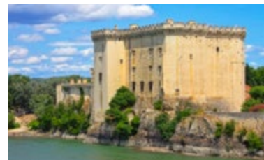
Château de Tarascon