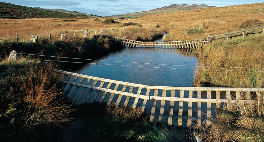
Houten constructies overspannen de De Lank River.

verder langs de muur, totdat deze naar rechts buigt. U blijft in dezelfde richting lopen en loopt over het onduidelijke spoor in het veenland. Na een tijdje licht omhoog te zijn gegaan ziet u één enkele rechtopstaande steen, daarna het omheinde terrein van King Arthur's Hall . U gaat hier in een rechte lijn voorbij, komt bij een hoek van een muur en blijft aan de rechterkant van de veldmuur lopen, tot u na ongeveer een kilometer de huizen Casehill en Candra bereikt.