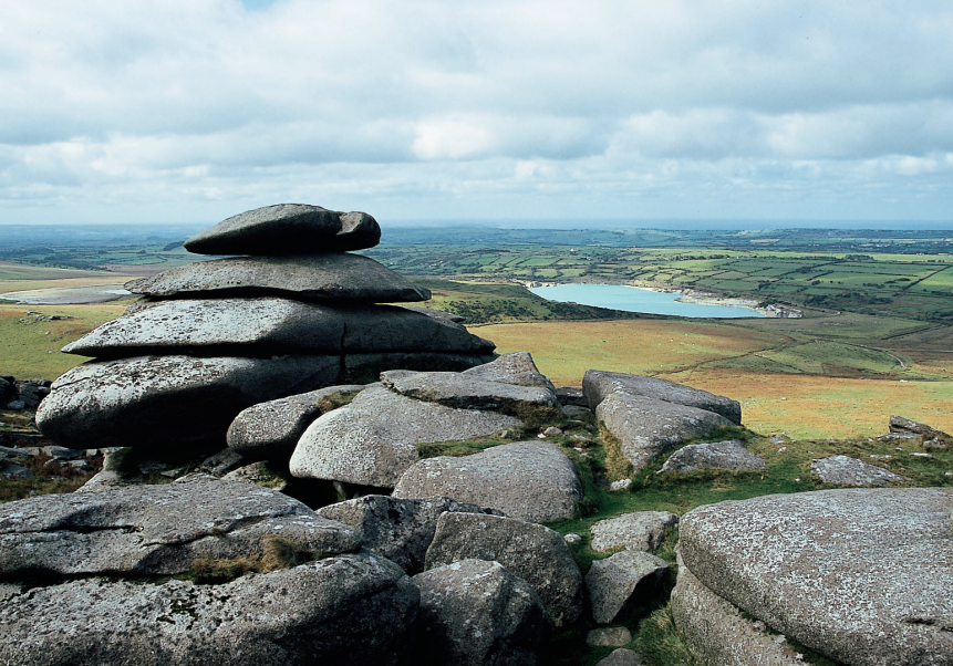
Op de Rough Tor.