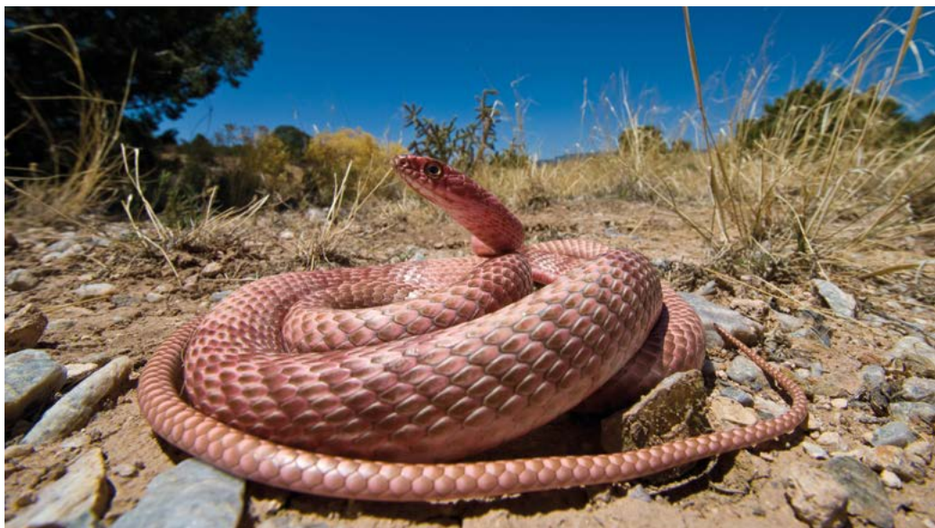
Zweepstaartslang in het Cerrillos Hills State Park.

De Sonorawoestijn in Arizona is met 10.000 jaar nog relatief jong en omvat de laaglanden en bekkens die zich vanaf Phoenix tot in Mexico uitstrekken. Er valt hier twee keer per jaar neerslag, in de zomer (een zogenaamde 'moesson') en in de winter, wat dit tot verreweg de groenste