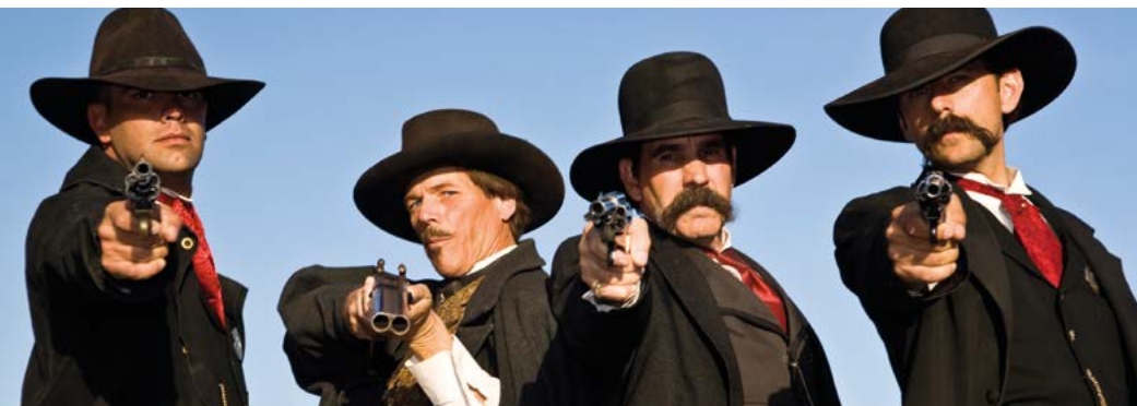
Acteurs in Tombstone.