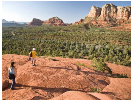
Wandelaars in de omgeving van Sedona.

Maak u op voor een waar avontuur. Zuidwest-Amerika is een regio waar dromen nog altijd werkelijkheid worden.