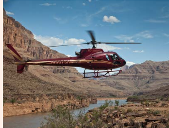
Helikopter boven de Grand Canyon.

De delen van de East en de West Rim van de Grand Canyon die buiten het park in indianengebied liggen, komen steeds meer onder druk te staan naarmate het toerisme blijft toenemen. In Grand Canyon West, ten noorden van Kingman in Hualapagebied,