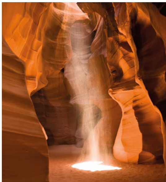
Antelope Canyon, Arizona.

Het op een na oudste gesteente in de Grand Canyon, dat op de Vishnu Schist ligt, is maar