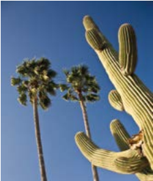
Palmbomen en een reuzencactus.

Een gedetailleerde gids van Zuidwest-Amerika, waarbij de belangrijkste bestemmingen met een cijfer (of letter) zijn aangegeven op de kaartjes (bijvoorbeeld 1 ).