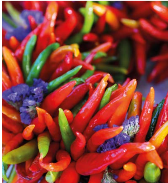
Chilipepers met gedroogde bloemen.

De eersten die het concept van een keuken van het Zuidwesten uitdroegen, was een groep koks uit Texas die The Big Five werd genoemd. Hun tex-mexkeuken combineert Westerse en Mexicaanse ingrediënten, met de nadruk op vlees, kaas en chilipepers. De lichtere New South-