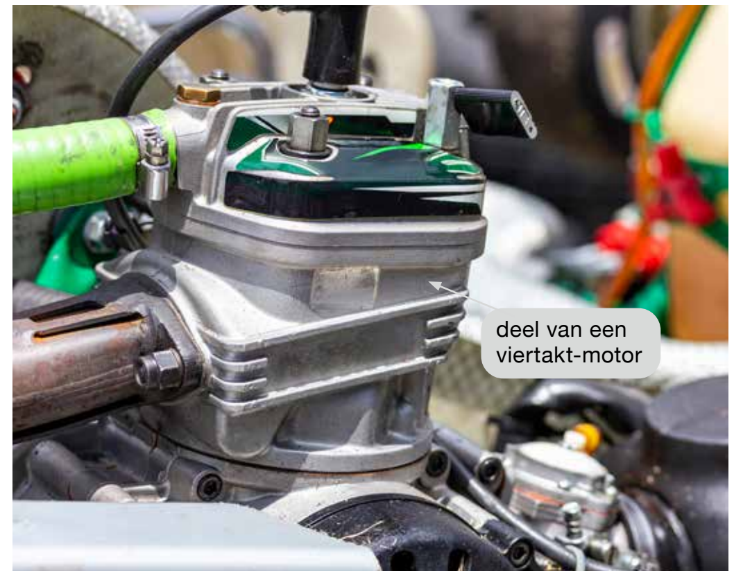
deel van een viertakt-motor

Karts hebben een tweetakt-motor of een viertakt-motor. Tweetaktmotoren zijn licht en snel. Viertaktmotoren zijn geschikt voor lange afstanden. Ze zijn vaak iets zwaarder en gebruiken minder brandstof .