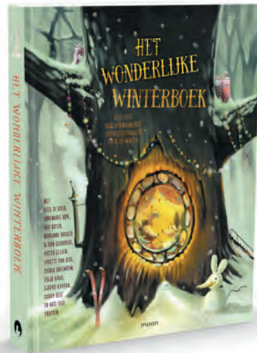
Het wonderlijke winterboek