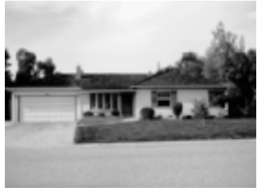
Het huis in Sunnyvale met de garage waarin Apple werd geboren