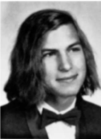
Het portret in het jaarboek van Homestead High, 1972