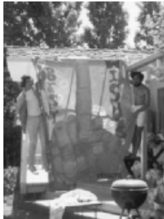
Met het spandoek 'SWAB JOB'