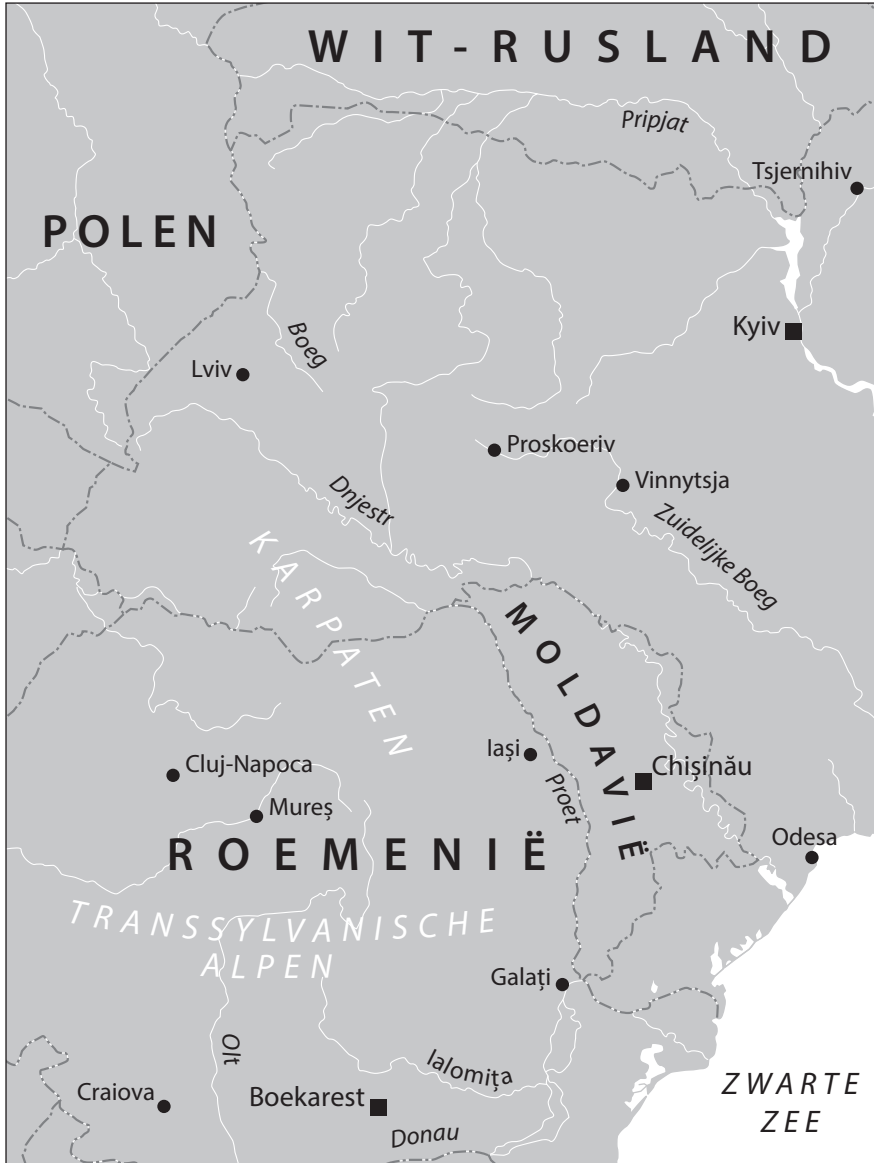
Oekraïne aan de vooravond van de Russische invasie, 24 februari 2022.