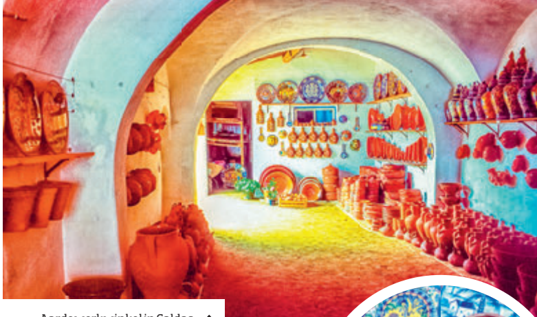
Aardewerkwinkel in Caldas da Rainha met plaatselijke keramiek (inzet) ↑