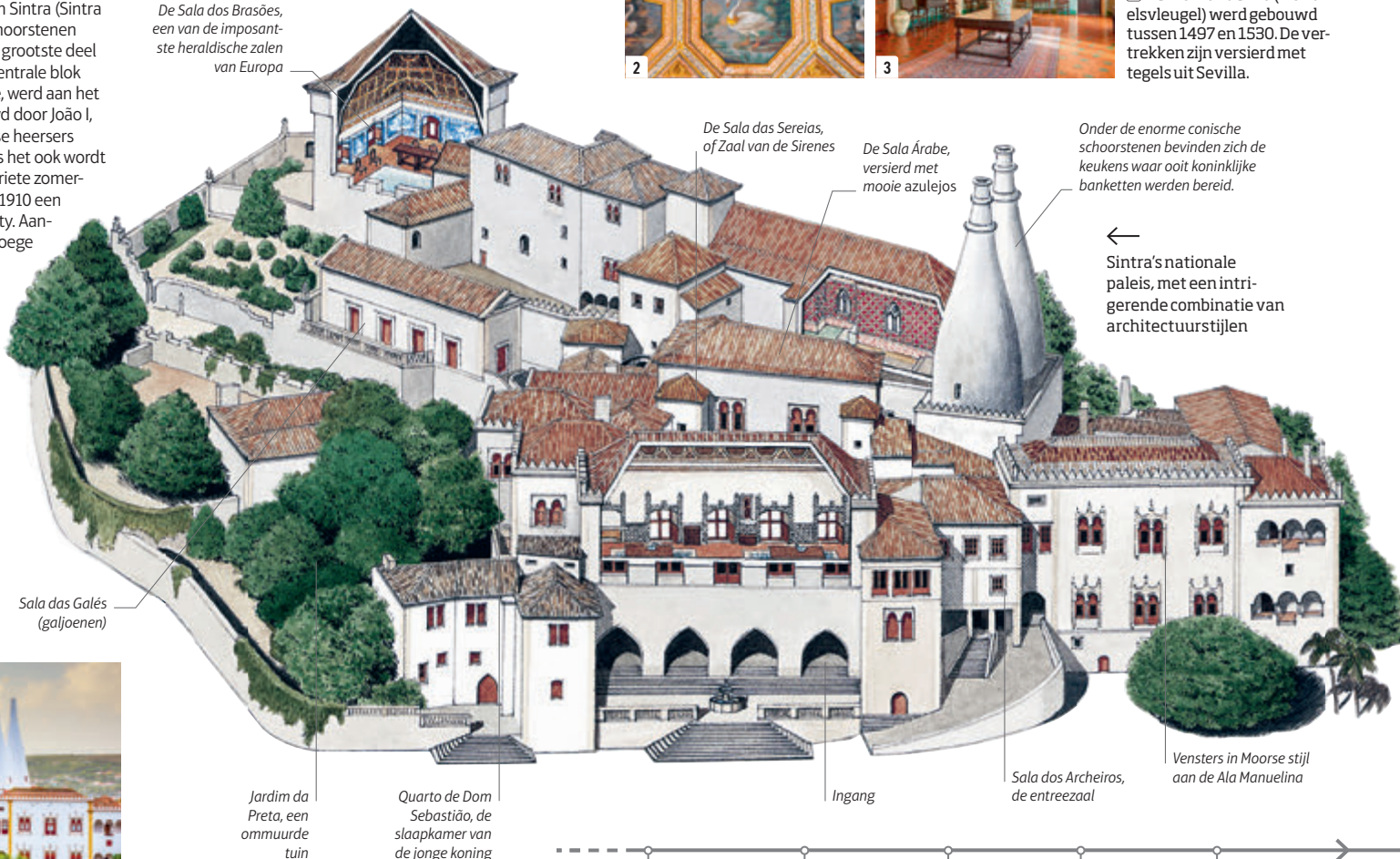
Sala das Galés (galjoenen)

← Sintra's nationale paleis, met een intrigerende combinatie van architectuurstijlen