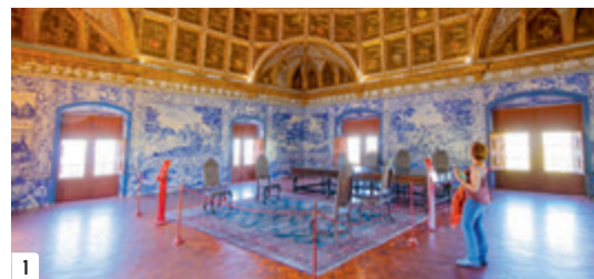
De Sala dos Brasões, een van de imposantste heraldische zalen van Europa

In het hart van de oude stad van Sintra (Sintra Vila) verheffen zich conische schoorstenen boven het Koninklijk Paleis. Het grootste deel van het paleis, waaronder het centrale blok met zijn sobere gotische façade, werd aan het eind van de 14de eeuw gebouwd door João I, op een plek die ooit door Moorse heersers werd bezet. Het Paço Real, zoals het ook wordt genoemd, werd al snel het favoriete zomerverblijf van het hof en bleef tot 1910 een residentie voor Portugese royalty. Aanvullingen door Manuel I in de vroege 16de eeuw weerspiegelen de Moorse stijl. Het paleis kent verschillende niveaus, in overeenstemming met de berg waarop het staat.