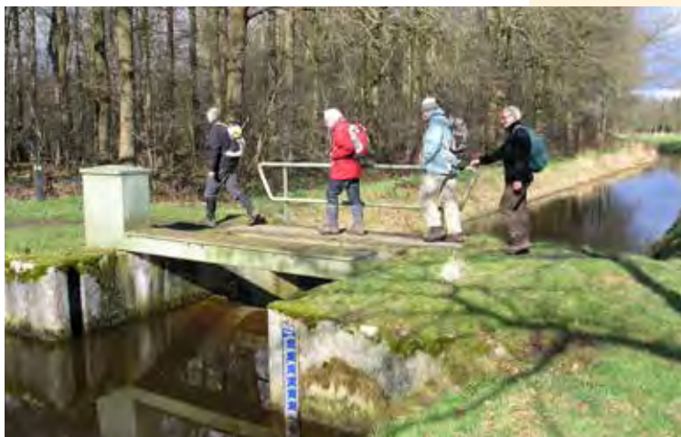
Stuw in de Reusel