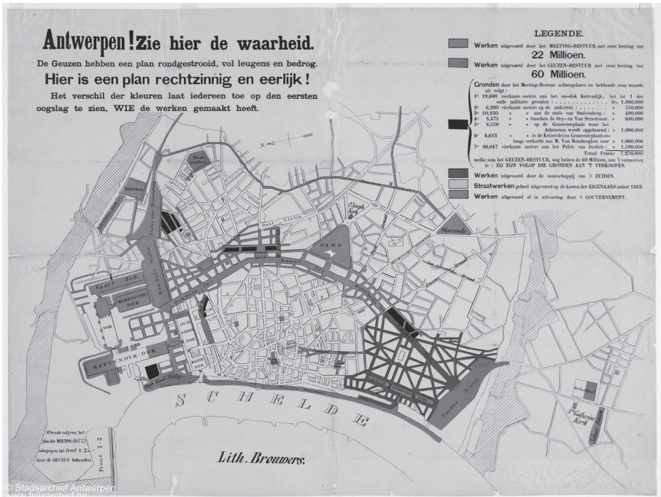
Afbeelding 1 Verkiezingspamflet van de Meetingparty in de jaren 1880. De polemiek met de Antwerpse liberalen over wie de stadsvernieuwing op zijn conto mocht schrijven, illustreert goed hoe stormachtig Antwerpen groeide in die jaren.

langzaamaan verdrongen door kaarsrechte straten als de Nationalestraat. Met het rechtekken van de Scheldekaaien verdween bovendien de middeleeuwse stadskern rond het Steen, het voormalige poortgebouw van de middeleeuwse walburcht.