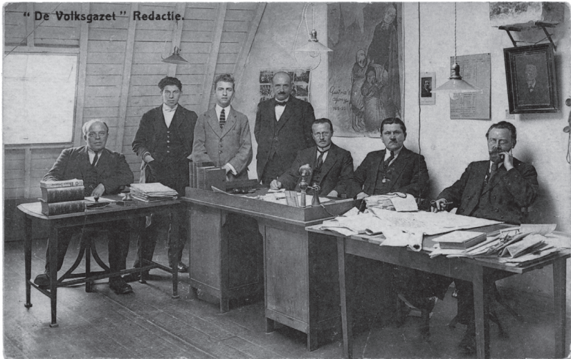
Afbeelding 3 De redactie van de socialistische krant De Volksgazet in de jaren 1920 (Collectie Stad Antwerpen, Letterenhuis).