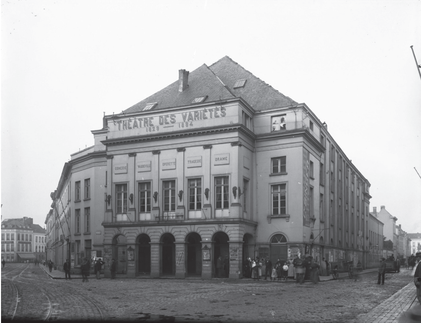
Afbeelding 4 Théâtre des Variétés in de Maarschalk Gerardstraat 1894. In de negentiende eeuw was de theaterzaal een populaire locatie om meetings te organiseren (Felixarchief, stadsarchief Antwerpen, GP#6766).

kransje stemgerechtigden, bestond er een premie voor de politicus die de massa van niet-stemgerechtigde burgers het best wist te bekoren. Zeker ook geen literaire overdrijving was de beschrijving in de roman van de vijandige overname van de meeting door het publiek, en de enigszins sympathiserende toon waarop Eekhoud die beschrijft. Tijdens negentiende-eeuwse meetings keek inderdaad niemand vreemd op van zulke bestormingen. Zulke vijandige overnames waren een logisch bijproduct van een meetingcultuur waarin het publiek een heel actieve rol was toebedeeld. Luid applaudiseren, jouwen, hard lachen, sprekers onderbreken, maar ook actief ingrijpen op het podium: het was vaste prik voor het publiek op de meeting.