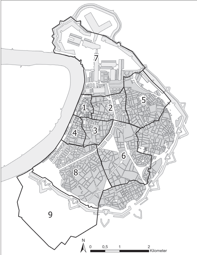
Kaart 1 Antwerpse politiewijken, 1884-1900.

beschikbaar waren. 40 Om de verschillende politiewijken ruimtelijk te kunnen plaatsen, zie kaart 1 en 2.