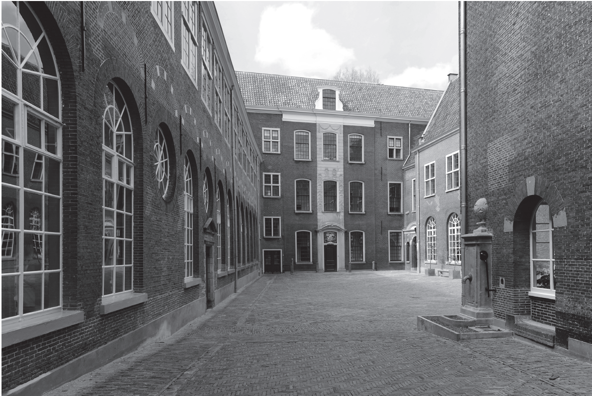
4 De binnenplaats van het weeshuis, zoals die er nu uitziet.

documenten bewaard gebleven en in dat opzicht is het archief van het weeshuis een unieke bron. De selectie die in dit boek wordt geboden, is mede bedoeld geïnteresseerde lezers en onderzoekers de weg naar de volledige collectie te wijzen. Die collectie wordt bewaard bij Erfgoed Leiden en Omstreken en is inmiddels ook online te raadplegen. 9