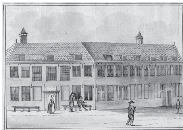
5 Arme Kinder- of Houwhuis aan de Middelweg in Leiden.