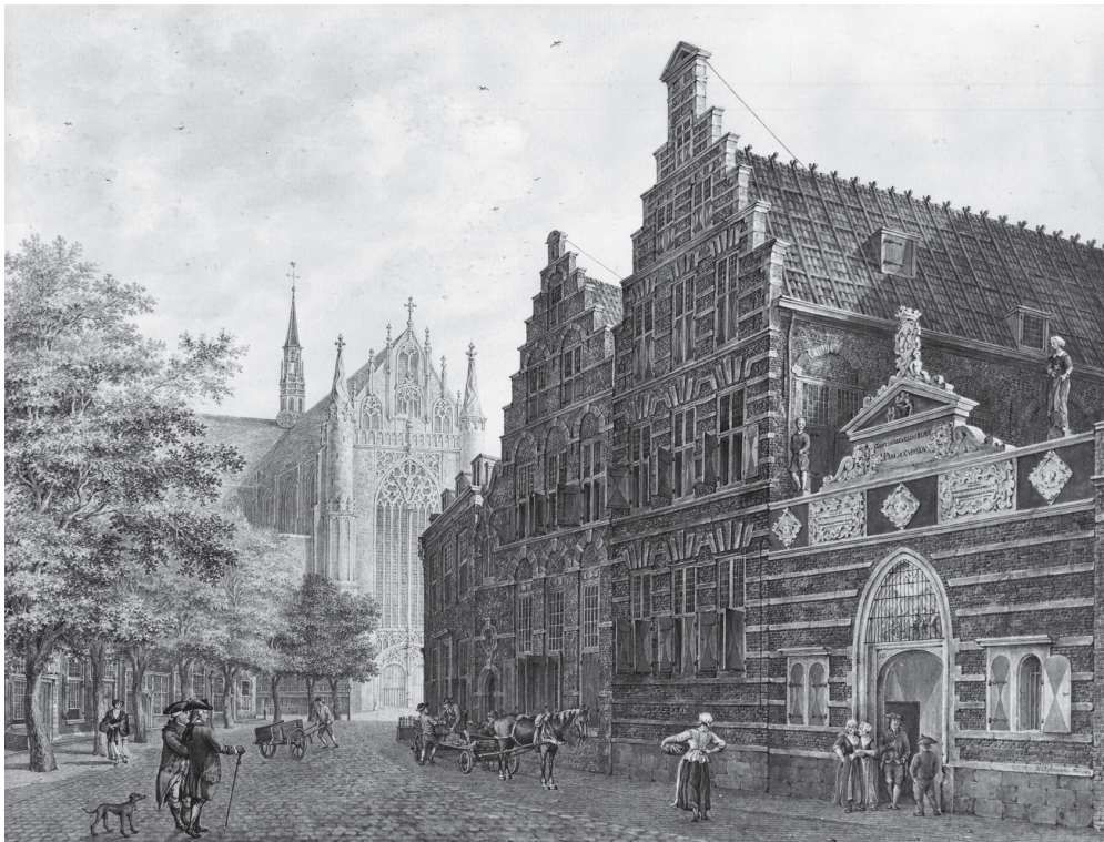
2 Gezicht op de Hooglandsekerkgracht met het Weeshuis en de Hooglandse Kerk.

Foto van een aquarel van H.P. Schouten.