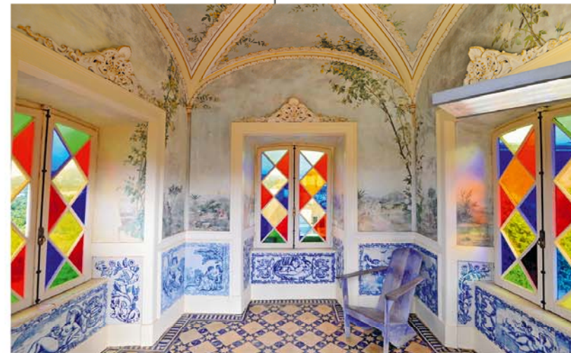
En dan is dit nog maar een priedeltje! Kun je nagaan hoe chic en soms ook buitennissig het paleis zelf eruit ziet.

Veemarkt: elke tweede zo. van de maand. Een groot en kleurrijk spektakel, waar ook groente, fruit en nog veel meer te koop is.