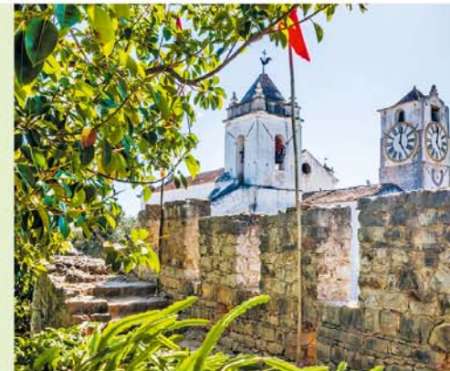
Het land waar de citroenen bloeien ligt niet alleen in Italië.

Na de verwoestingen die de aardbeving had aangericht, werd de kerk door de Italiaanse architect Francisco Xavier Fabri in classicistische stijl