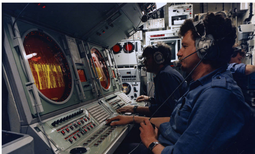
Sonaroperators in de commandocentrale van Hr.Ms. Tijgerhaai (Zwaardvisklasse) na de modernisering, maart 1989.