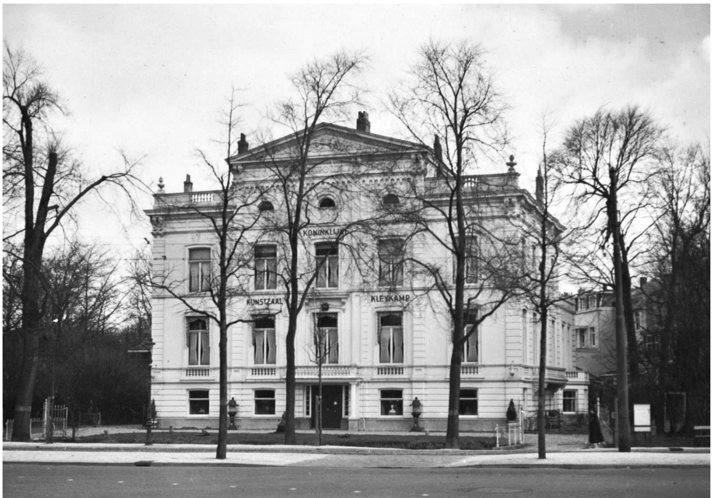
Fig. 1. Kunstzaal Kleykamp vóór het bombardement van 11 april 1944. Oude Scheveningseweg 17 Den Haag.