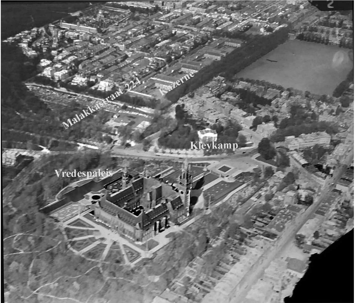
Fig. 3. Luchtfoto doelgebied Kleykamp en het Vredespaleis. De auteur lag in dekking in de Malakkastraat. Datum foto vóór 1944.