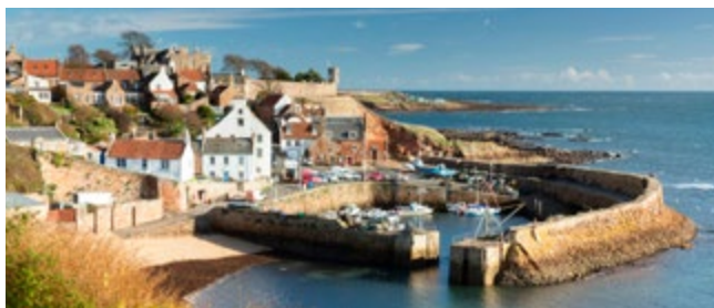
Pittoresk vissersplaatsje aan East Neuk

Neuk is een Schots woord voor 'hoek', en East Neuk verwijst naar een kleine bocht in de kustlijn waarlangs een opmerkelijke reeks pittoreske vissersdorpen ligt. Zij lopen van Earlsferry naar Crail, en elk is een juweeltje. Elie en Crail zijn de schilderachtigste en favoriete trepunten van kunstenaars. Pittenweems moorie haven is nog steeds actief, en Anstruther, een haven voor jachten, heeft een drukke strandboulevard. Het Scottish Fisheries Museum ( blz. 94 ) is zeker een bezoek waard.