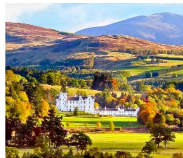
Blair Castle in Perthshire