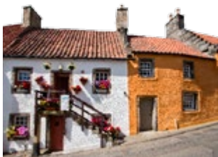
Bijzondere cottages in Culross

Twee uur rijden vanaf het centrum van Edinburgh en u bent ofwel in het majestueuze Hooglandenslandschap van Perthshire of in het rijke boerenland van Fife, met langs de kust leuke dorpjes. Dit deel van Schotland is overduidelijk het diversst, met beroemde kastelen, abdijen, schepen, bruggen, wildreservaten en golfbanen, allemaal gemakkelijk bereikbaar met de auto. Golf is Schotlands grootste sporttraditie en is hier zeer aanwezig – met name in St. Andrews, de geestelijke bakermat van de sport. De vele kastelen en paleizen getuigen van de voortdurende aantrekkingskracht van deze charmante en fotogenieke regio.