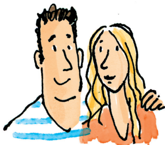
De ouders van Wies

De oma van Wies. Ze woont in Huize Grijsoord. Ze is dol op make-up en op mode.