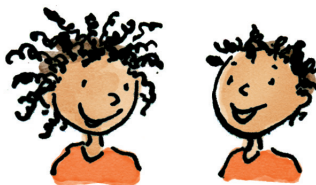
Zane en Jazz

Helpers (of ritselaars). Ze zijn altijd op reis, ze hebben veel geheimen en ze zijn dol op champagne.