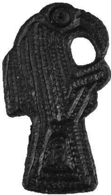
Vogelfibula uit de periode 450 - 725 na Chr., gevonden in de Katwijkse Zanderij.