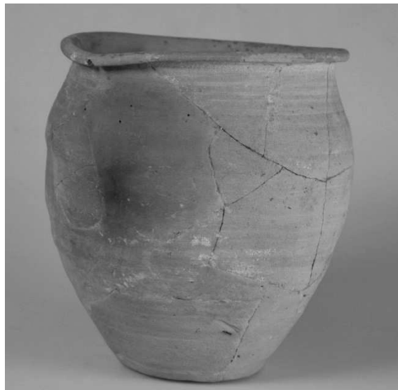
Geïmporteerd aardewerk uit de periode 450 - 525 na Chr., gevonden in Valkenburg De Woerd.

De Friezen waren een zeevarend volk, dat internationaal handel dreef over water. Hun woonplaatsen waren daarom geconcentreerd rond de riviermondingen, zoals de Rijnmond. Uit de vondsten in de Zanderij blijkt dat het gebied tot de kust-cultuur van de Noordzee behoorde, net als Engeland. Vanuit de kust werd ook veel handel gedreven met het Frankische gebied stroomopwaarts van de Rijn, want het meeste aan de kust opgegraven aardewerk kwam uit Duitsland. 18 De nederzetting in Rijngeest (Oegstgeest), gelegen aan een Rijntak, had aanlegplaatsen en was een handelsplaats. Daar en in de Zanderij stonden tweebeukige gebouwen, wat kenmerkend is voor toenmalige schuren. 19 Aangezien de boerderijen (al dan niet met kleine spiekers) voldoende ruimte hadden voor normale wintervoorraad, waren deze schuren waarschijnlijk bestemd voor handelsvoorraden.