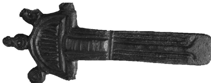
Beugelfibula uit de periode 450 - 525 na Chr., gevonden in de Katwijkse Zanderij.