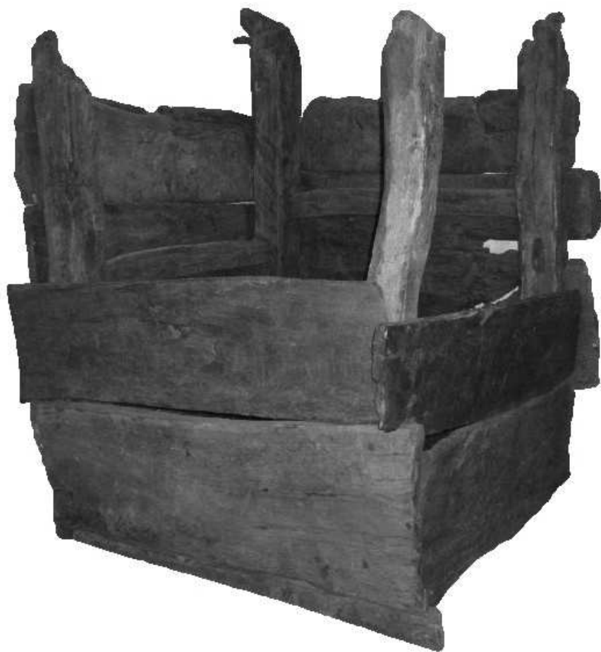
Houten waterput uit ca. 672, gevonden in de Katwijkse Zanderij. (inv.nr. 27241)