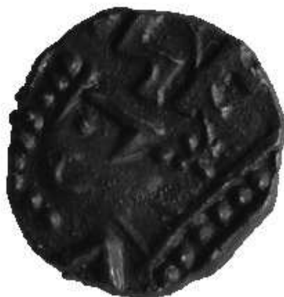
Friese munt (Sceatta) gevonden in Valkenburg De Woerd. (foto Provinciaal Archeologisch Depot provincie Zuid-Holland, inv.nr. 8967)