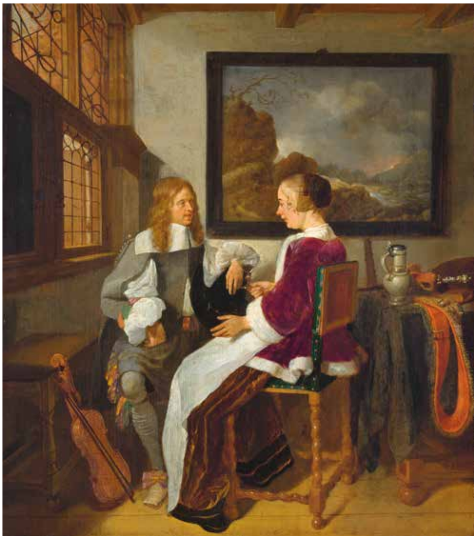
Emotioneel gesprek , Quirijn van Brekelenkam, ca. 1660, Metropolitan Museum of Art, New York.

Gezondheid vormt een terugkerend onderwerp in De Witts correspondentie met vrouwen, variërend van besmettelijke ziektes zoals mazelen en pokken tot aandoeningen die chirurgische correctie vereisten. Zwangerschap en moederschap worden ook vaak besproken. Zo informeerde Johanna haar broer Johan over een voor zijn pas geboren dochter beschikbare min die haar melkproductie op peil hield door zich te laten zogen door puppy's (p. 91). Zijn andere zuster Maria schreef hem in 1648 over hun