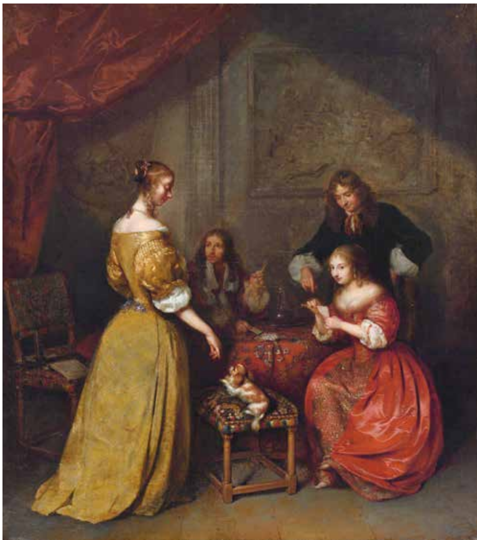
Het kaartpartijtje , Caspar Netscher, ca. 1665, Metropolitan Museum of Art, New York.