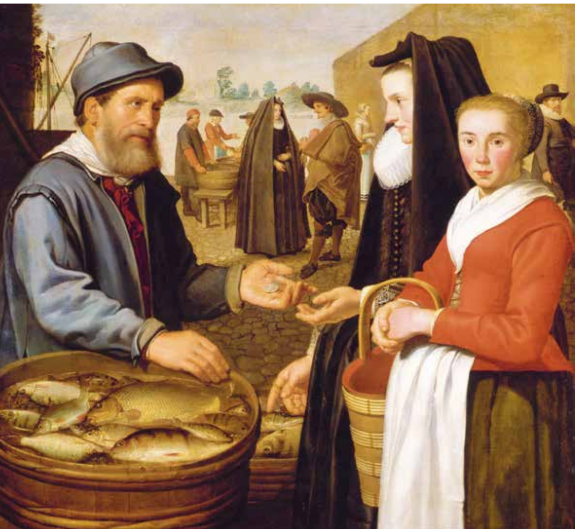
De vismarkt , Jacob Gerritsz. Cuyp, 1627, Dordrechts Museum, aankoop 1937.