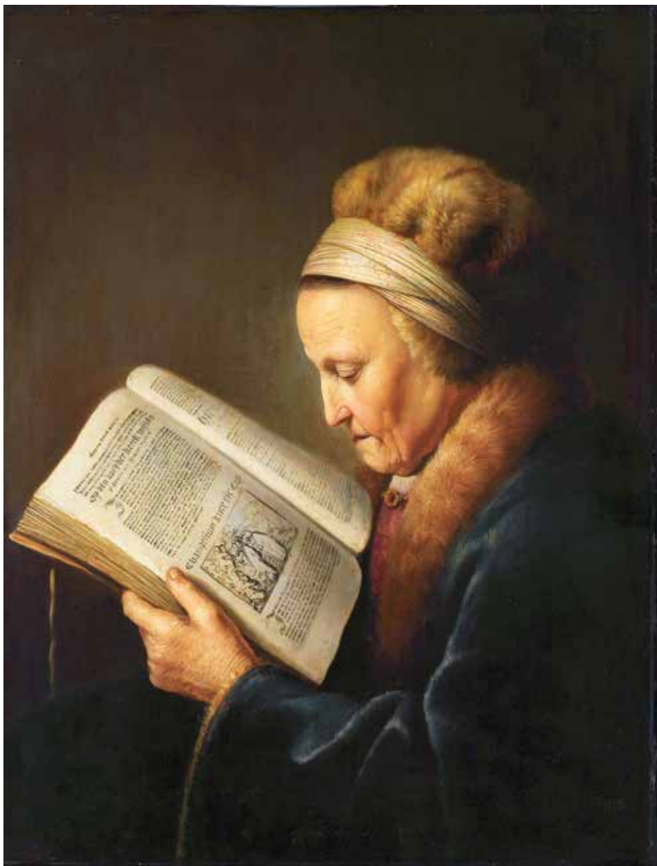
Lezende oude vrouw , Gerard Dou, ca. 1631-1632, Rijksmuseum, Amsterdam.