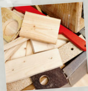
Werkplaats & werkblad blz. 257