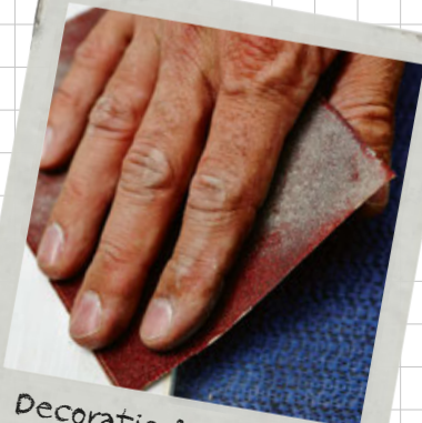
Decoratie & upcycling blz. 217