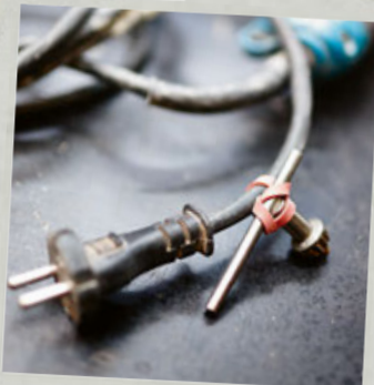
Reinigen & organiseren blz. 239