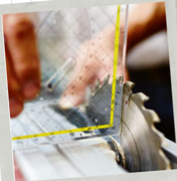
Zagen, schuren & frezen blz. 127