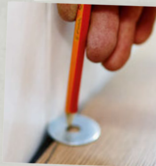
Sjablonen, meten & markeren blz. 179