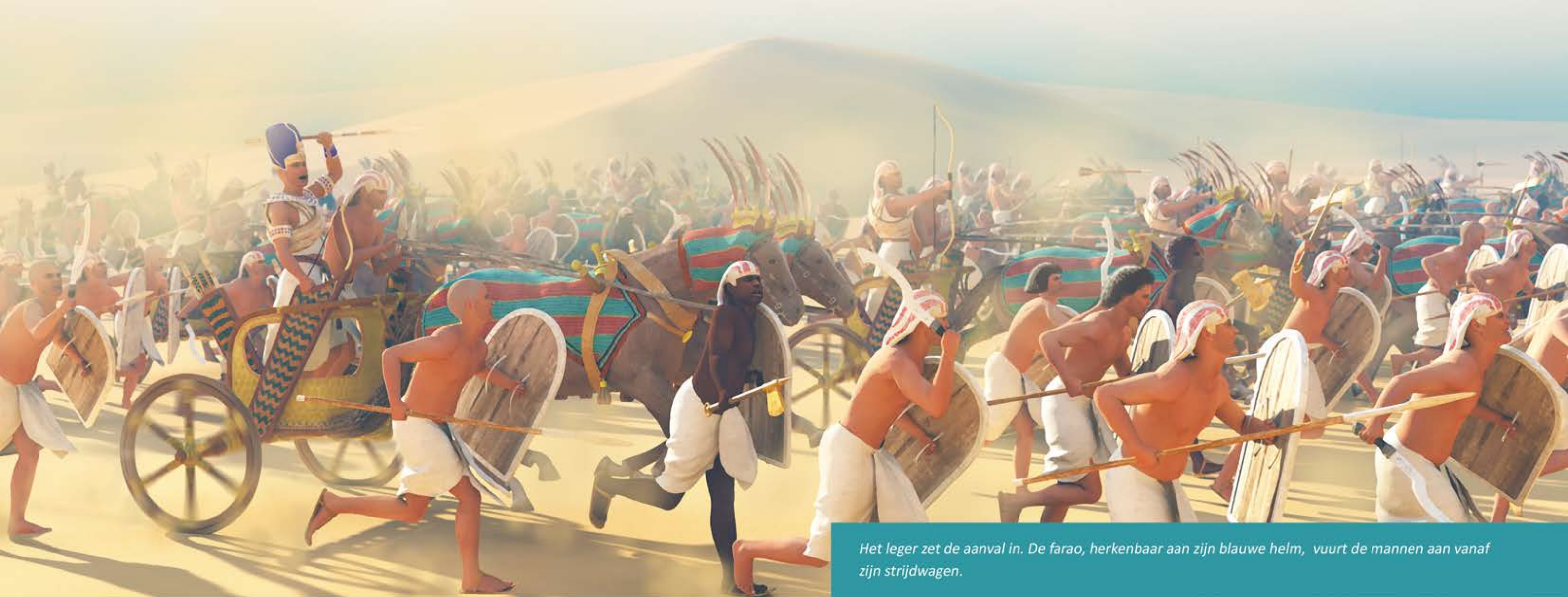
Het leger zet de aanval in. De farao, herkenbaar aan zijn blauwe helm, vuurt de mannen aan vanaf zijn strijdwagen.