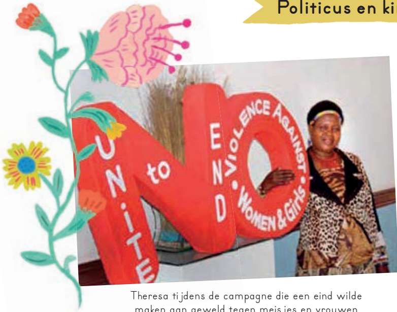
Theresa tijdens de campagne die een eind wilde maken aan geweld tegen meisjes en vrouwen

Politicus en kinderrechtenactivist in Malawi