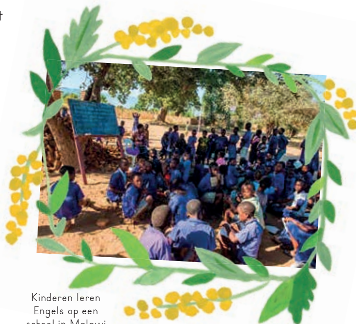
Kinderen leren Engels op een school in Malawi

“Met een opleiding kunnen ze zijn en worden wat ze willen.”