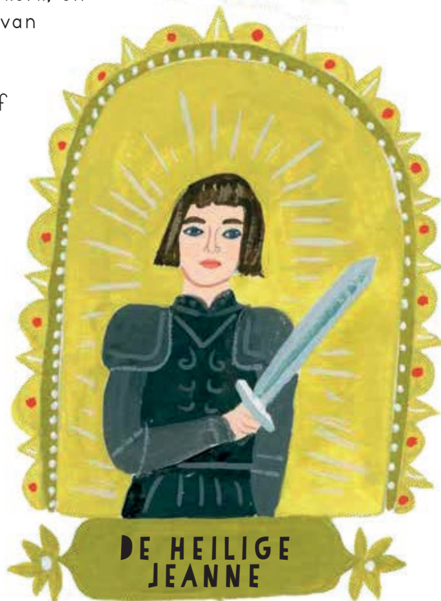
DE HEILIGE JEANNE

“Als ik het niet ben, moge God mij daar brengen; als ik het wel ben, moge God mij daar houden.”