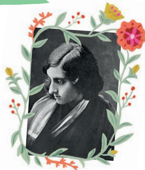
Indira als jong meisje

Omdat haar vader vaak weg was en haar moeder vaak ziek, was Indira een eenzaam kind. Geïnspireerd door Jeanne d'Arc en Mahatma Gandhi, de man die de Indiase onafhankelijkheidsstrijd was begonnen, probeerde ze haar steentje bij te dragen door schoolkinderen met posters en andere activiteiten te betrekken bij de campagne om India te bevrijden.