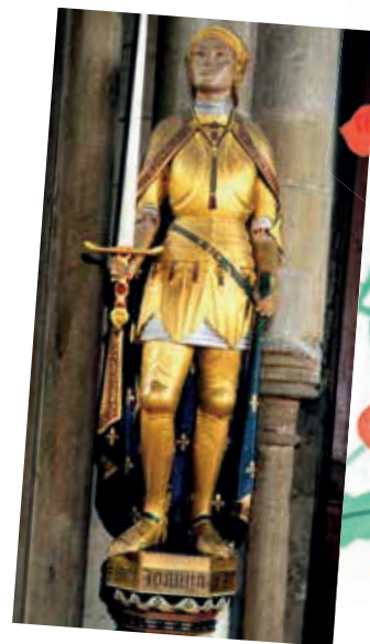
Beeld van Jeanne in de kathedraal van Winchester, Engeland

“Ik zou liever sterven dan iets zondigs doen, of tegen Gods wil in gaan.”