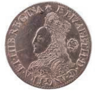
Elizabeths portret op een munt

Een van de beste staatshoofden van Engeland en stichter van een wereldrijk