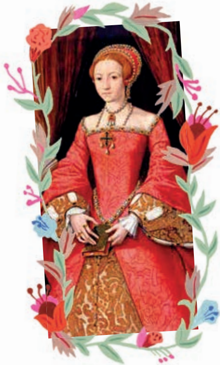
Elizabeth als jonge vrouw

“Ik ben liever een vrijgezelle bedelaar dan een getrouwde koningin.”