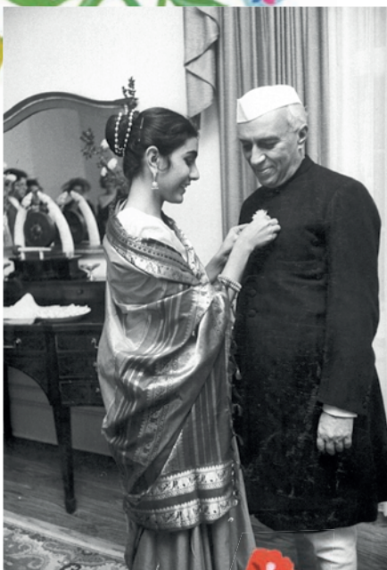
Indira met haar vader, Jawaharlal Nehru

“Onze grootste prestatie is dat we het als vrij, democratisch land gered hebben.”