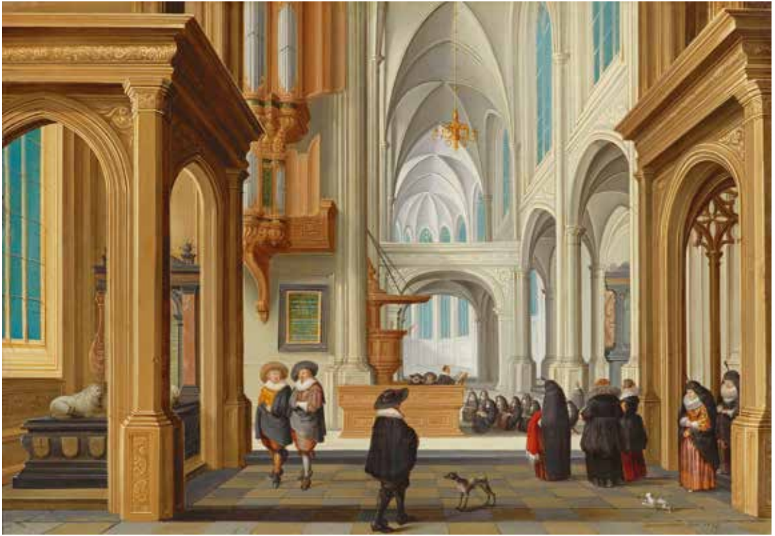
61. DIRCK VAN DELEN, PROTESTANTS KERKINTERIEUR MET DOOPPROCESSIE , 1629. RICHMOND, JOHNNY VAN HAEFTEN LTD. OLD MASTERS ART GALLERY