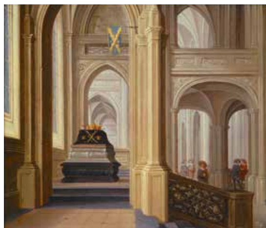
64. DIRCK VAN DELEN, KERKINTERIEUR MET KONINKLIJKE GRAFTOMBE , 1629. PARTICULIERE COLLECTIE, MET DANK AAN JOHNNY VAN HAEFTEN LTD

habsburgers geassocieerde kronen en op het doodskleed staan de vuurslag en het andreas-kruis van de Orde van het Gulden Vlies.