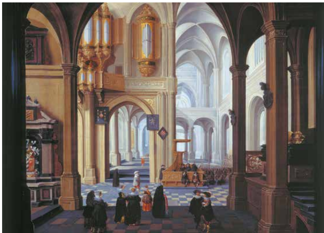
63. DIRCK VAN DELEN, PROTESTANTS KERKINTERIEUR MET DOOPPROCESSIE , CA. 1631. PARTICULIERE COLLECTIE, MET DANK AAN JOHNNY VAN HAEFTEN LTD

katholiek kan zijn. Een Protestants kerkinterieur met doopprocessie uit 1629 heeft weer de renaissanceistische voorhal, maar ditmaal geen transeptachtige dwarsruimte over de volle breedte direct daarachter [afb. 61]. Aan de rechterzijde sluiten namelijk de eerste twee traveeën van het schip aan op de voorhal, al is onduidelijk hoe. Bovendien hebben deze eerste traveeën geen linkerzijde, zodat het buiten beeld zijnde gewelf nergens kan worden opgevangen.