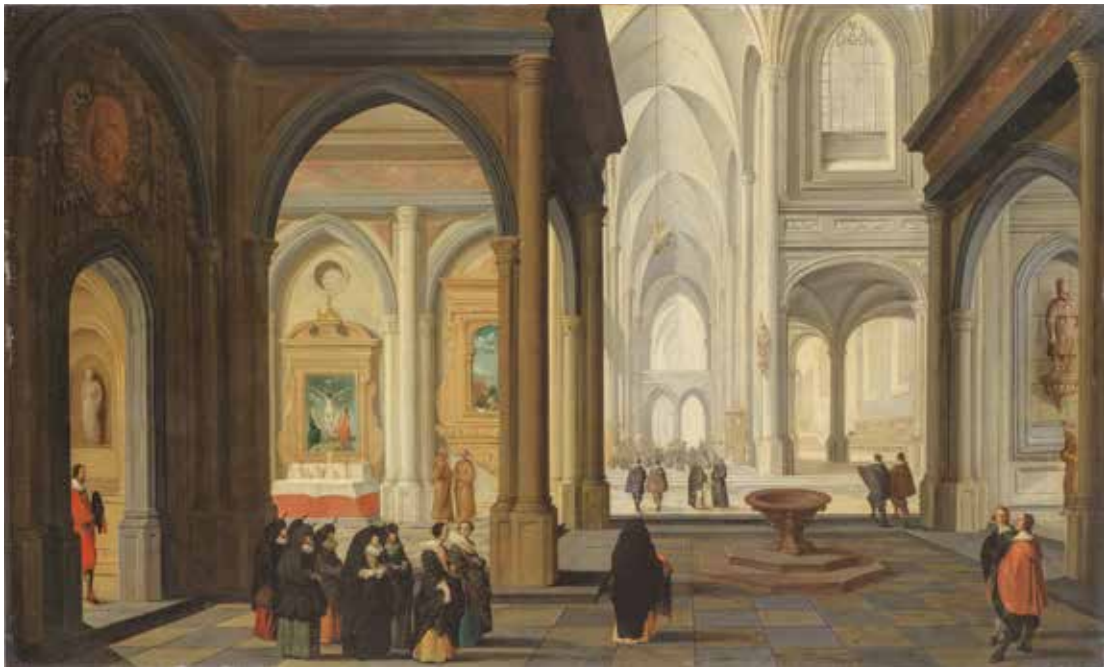
62. DIRCK VAN DELEN, KATHOLIEK KERKINTERIEUR MET DOOPPROCESSIE , CA. 1630. ANTWERPEN, THE PHOEBUS FOUNDATION