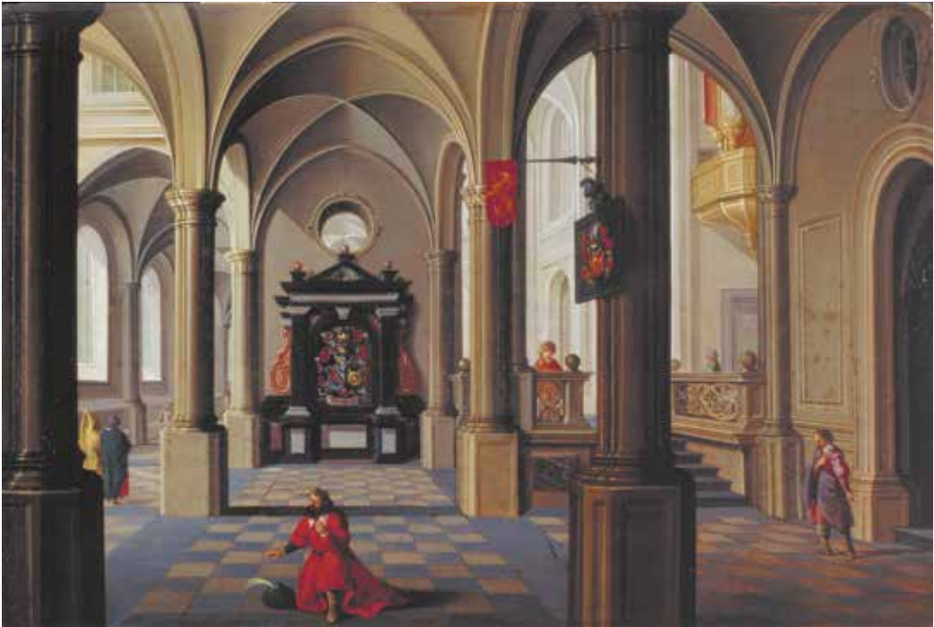
10. DIRCK VAN DELEN, KERKINTERIEUR MET TOMBE MET DE FAMILIEWAPENS VAN DER GRACHT EN SPIERING (VAN AALBURG) , 1628. GENÈVE, MUSÉE D'ART ET D'HISTOIRE

vooral herinnerd door zijn rol als watergeus in de Slag bij Reimerswaal (29 januari 1574). P.C. Hooft schrijft hierover in zijn Nederlandsche Historien , negende boek, pagina 347: