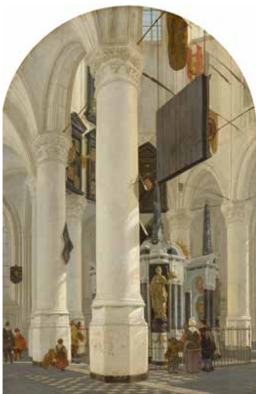
2. GERARD HOUCKGEEST, INTERIEUR NIEUWE KERK DELFT , 1650. DEN HAAG, MAURITSHUIS

in de uitbeelding van architectuur en vooral ruimte. In 1979 werd het nog eens onveranderd heruitgegeven, al was het ook toen al zwaar verouderd door de groei aan voorhanden zijnd beeld- en archiefmateriaal.