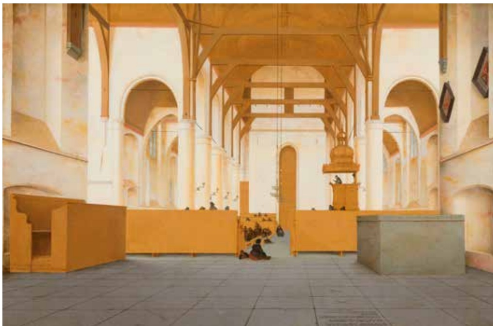
1. PIETER SAENREDAM, INTERIEUR SINT-ODULPHUSKERK ASSENDELFT , 1649. AMSTERDAM, RIJKSMUSEUM