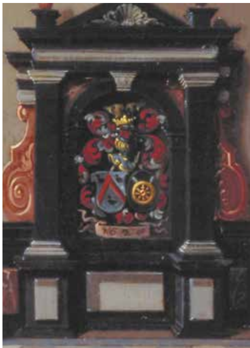
11. WAPENS VAN DER GRACHT EN SPIERING (VAN AALBURG), DETAIL UIT VAN DELENS KERKINTERIEUR , 1628, AFB. 10

een geslacht met adellijke pretenties. In 1628 schilderde Dirck een kerkinterieur met centraal een grote (gefantaseerde) graftombe met de wapens van zijn schoonouders: Van der Gracht (in zilver een lage rode keper vergezeld van drie zwarte merletten) en Spierinck/Spiering van Aalburg (in zwart een gouden wiel met spaken) (afb. 11). Of Maijke nog banden had met Heusden is onbekend, maar valt niet uit te sluiten. 7 Voor de vraag of dit een rol speelde bij Dircks komst naar Zeeland geldt hetzelfde. Maar feit is dat Dirck zijn leven lang op de een of andere manier verbonden lijkt te zijn gebleven met de regio rond Heusden. 8