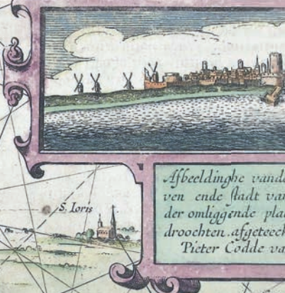
Afbeeldinghe vande ven ende stad van der omliggende pla droochten afgeteech Pictet Coddé va

Een ghemeene Duytsche Mijle Vne Lieu Commune.